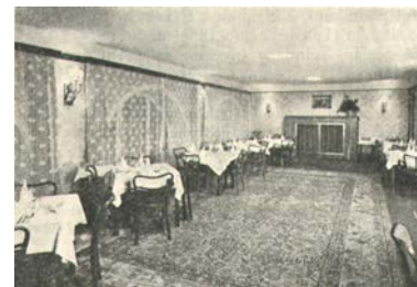
Francouzský restaurant v interiéru Elektry, 1947.