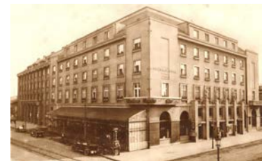
Elektra, 1928, pohlednice.