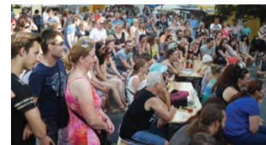
Rozmarné slavnosti řeky Ostravice zorganizoval klub Atlantik na březích řeky už podruhé.

Česko-německé kulturní dny,“ pokračuje a dodává, že i v roce 2017 bude pro klub Atlantik stěžejní každodenní program, který nabízí divadelní představení, cestopisy, výstavy, kulinařské akce, workshopy, semináře, filmové projekce, komentované prohlídky města a mnoho dalšího. „Novinkou bude zapojení festivalu Ostrau der Kulturpunkt do mezinárodního projektu Česko-německé kulturní jaro, který bude v Ostravě zahájen 30. března. Pokračovat budeme s osvědčenými akcemi, jako jsou třeba pravidelné zájezdy pro seniory, literární večery nebo oblíbený Stesk kavárenského povaleče z dílny režiséra Radovana Lipuse. Určitě se budeme opět podílet na více celoměstských akcích, k nimž patří například Ostravská muzejní noc, Festival domácí kuchyně Restau-