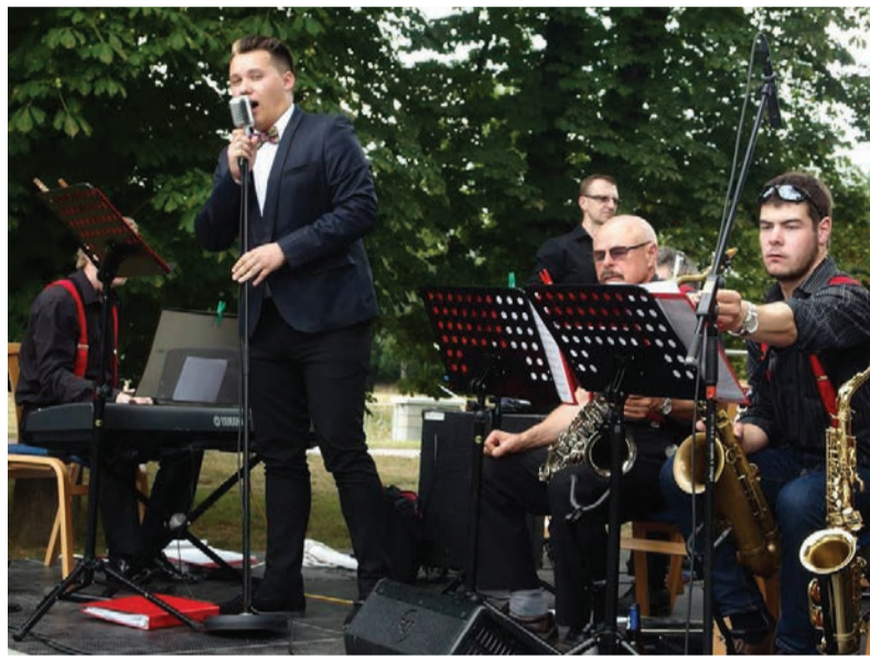
Oblíbené byly i promenádní koncerty klubu Atlantik v Komenského sadech.